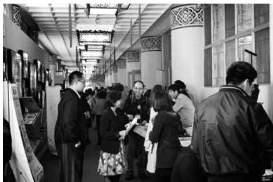
圖 8 2014 年圖書資訊展展場一隅