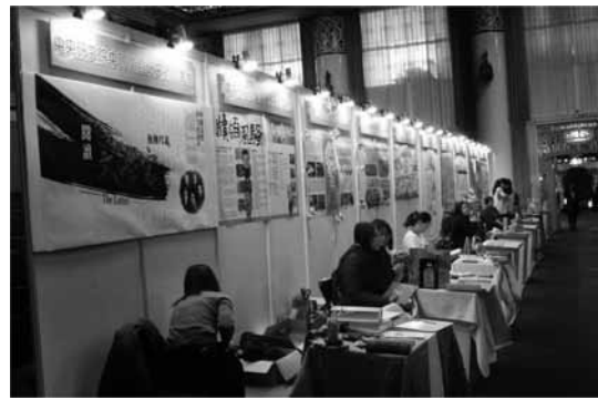
圖7 2014年專門圖書館海報展展場一隅

經過激烈的競爭，海報展票選結果：第一名是行政院農業委員會林業試驗所的「樹木的永生——林業古籍之典藏與修復」；第二名是中央研究院臺灣史研究所檔案館的「牘領風騷——典藏臺灣文化多元視角」；第三名是中央研究院中國文哲研究所圖書館的「閱讀文學家@中國文哲研究所園」及馬偕醫學院圖書館的「寧願燒盡，不願鏽壞：馬偕台灣紀行導入醫學人文課程」；佳作是香光尼眾佛學院圖書館的「佛教圖書館提供您——薪·新·欣的閱讀」及財團法人金屬工業研究發展中心的「老館欣力——圖書館大改造」。