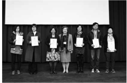
圖7 2014年資訊素養示範教材徵選活動得獎者與頒獎人合影