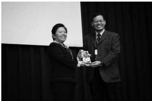
圖5 2014年熱心服務獎得獎者與頒獎人合影