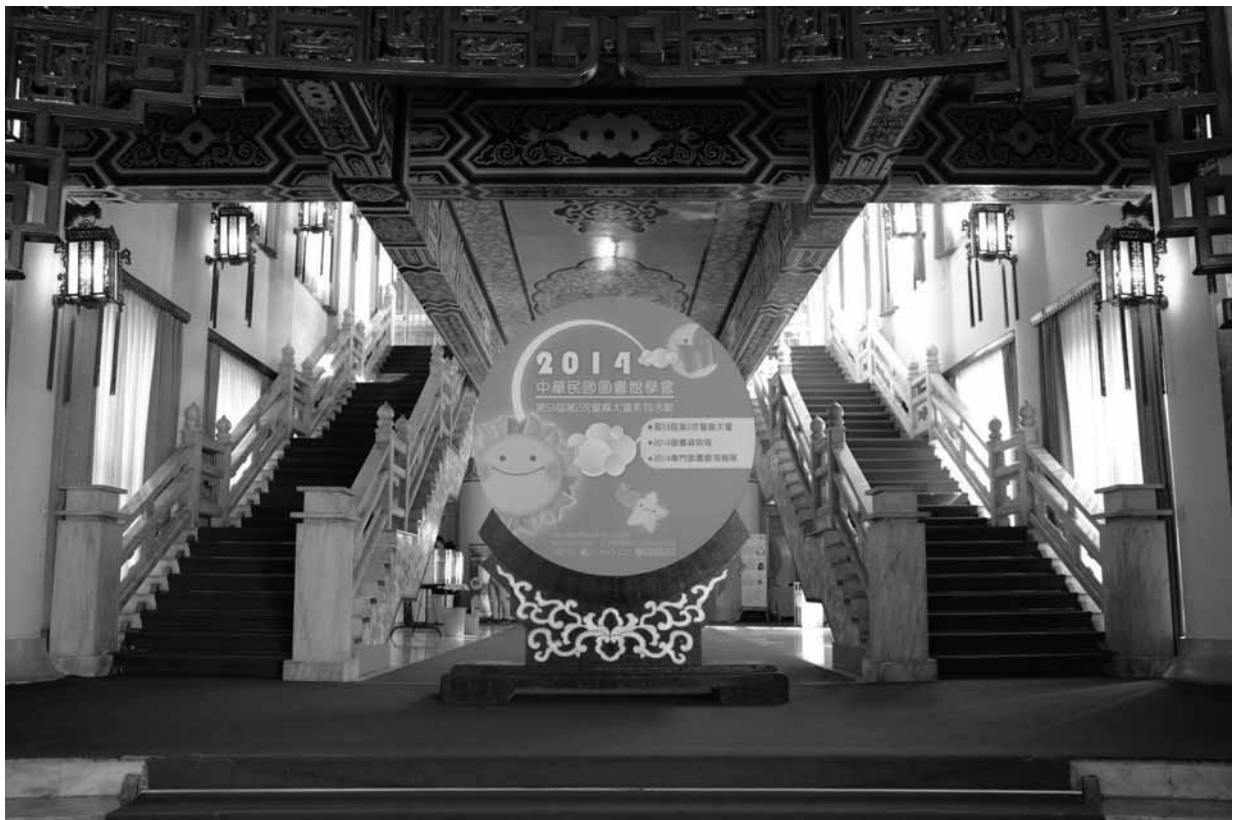
圖9 中華民國圖書館學會2014年會主視覺看板