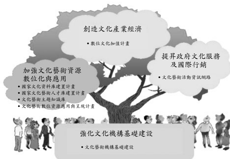
圖一：網路文化建設發展計畫願景示意圖（筆者自繪）

本計畫定位為運用「網路文化建設發展計畫」已建置的數位內涵，鼓勵與獎助學界、業界以及文化機關共同開發文化藝術類教材與學習，強化文化學習廣度與深度，俾使文化藝術學習多元化與活潑化。相關子計畫臚列如下：